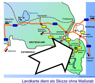
Landkarte dient als Skizze ohne Maßstab

ANREISE: Auto: MÜNCHEN SALZBURG Flughafen SALZBURG 20 km (Shuttlebusse) Flughafen MÜNCHEN 150 km (Shuttlebusse) Zug München-Salzburg-Wien